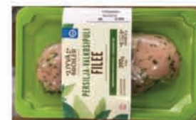
1 - Platformed Tray Skin