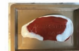
2 - Paperseal Skin