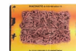
3 - Slimfresh