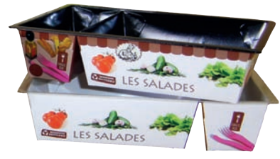
BARQUES HYBRIDES TRAVE

Deux compartiments : un pour les produits et un pour les accessoires.