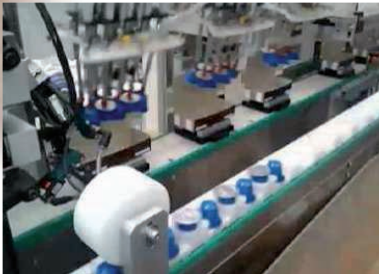
Robot 6 axes avec 3 stations de remplissage