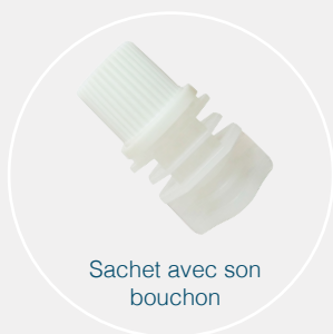
Sachet avec son bouchon

Effytec : c'est un constructeur d'ensacheuses horizontales FFS. Pour la réalisation de sachets Doypacks ou à plat.