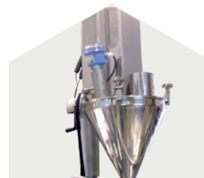
Vis sans fin pour les produits en poudre