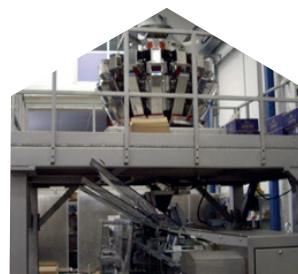
Peseuse associative pour les produits en morceaux