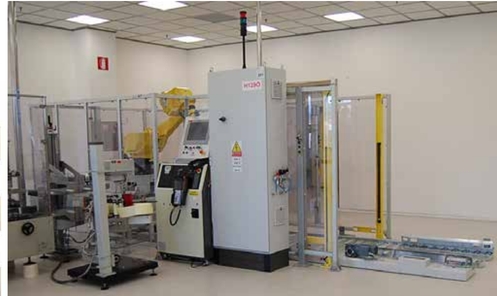
Exemple d'installation d'une cellule de palettisation compacte dans une usine pharmaceutique

Ce palettiseur compact et flexible, proposé par CM-OPM en partenariat avec OASI.S, est la solution idéale pour les fins de lignes simples d'emballage.