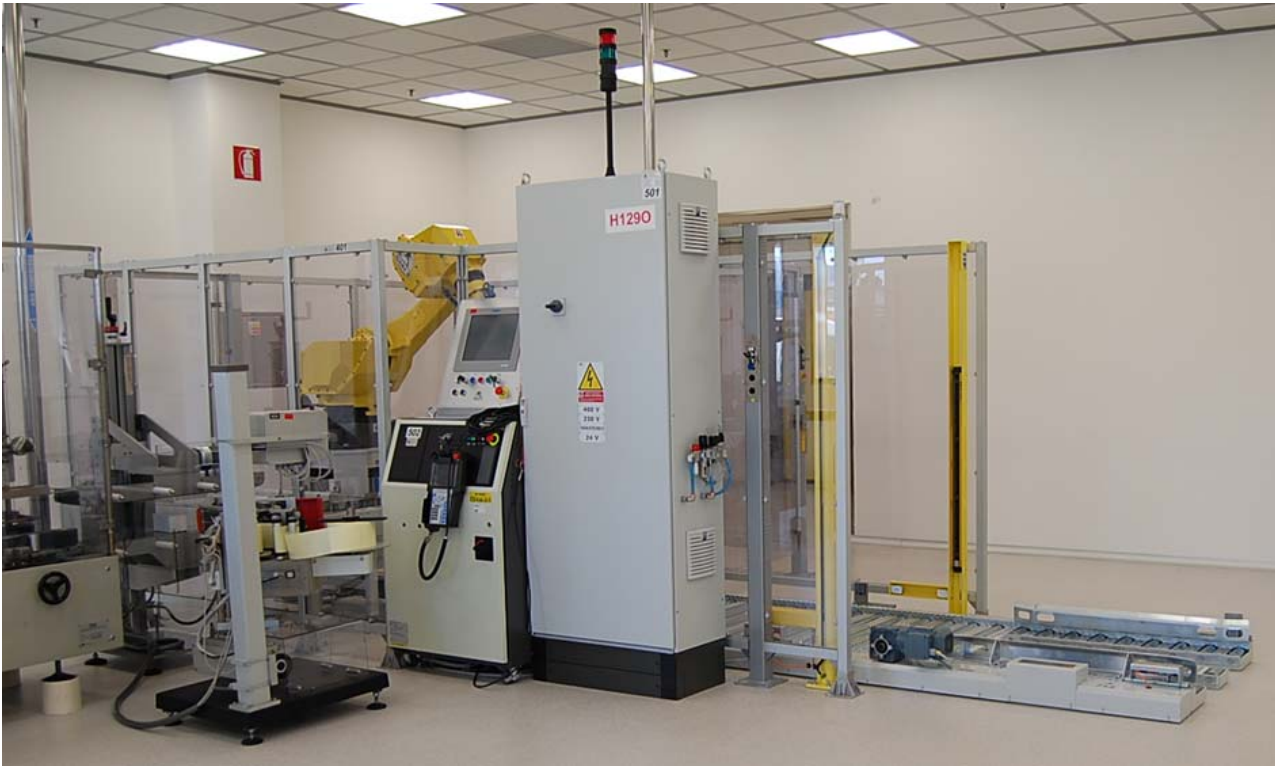
Exemple d'installation d'une cellule de palettisation compacte dans une usine pharmaceutique